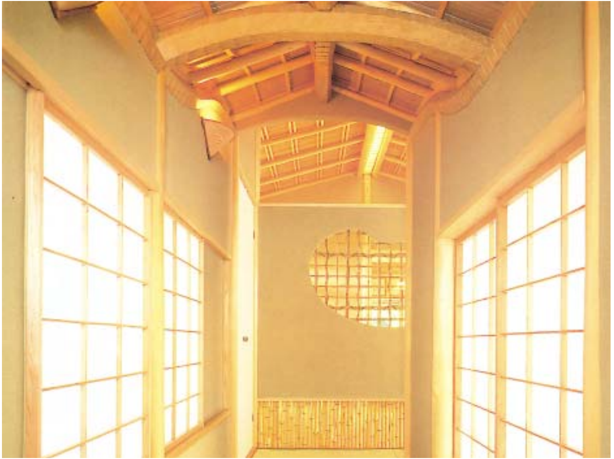
廊下棟木、廻りに本名栗を使用