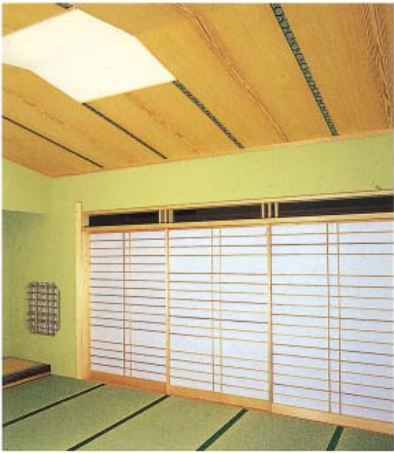
天井板・杉中杵(巾広)使用