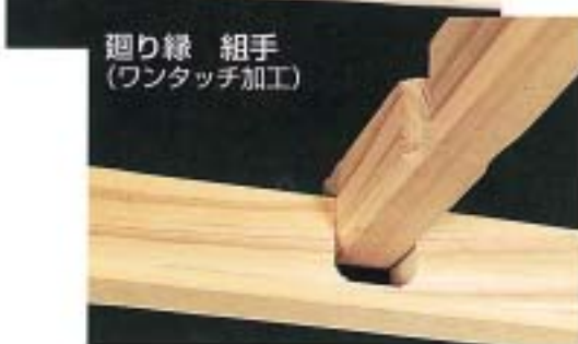
廻り縁 組手 (ワンタッチ加工)