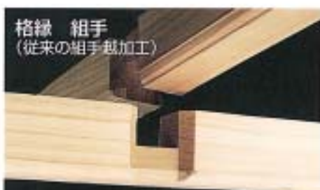
格縁 組手 (従来の組手越加工)