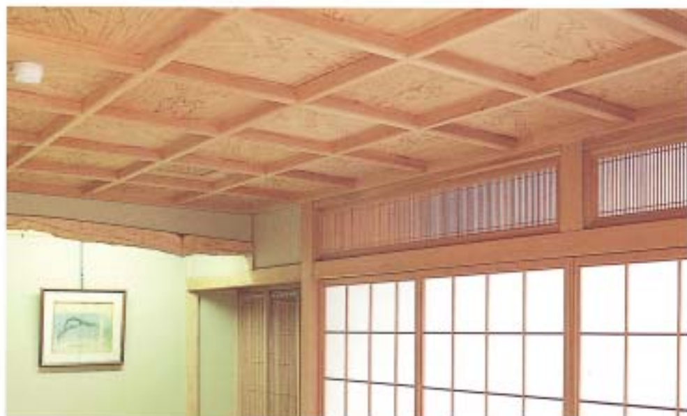
▲杉使用例 写真の天井板は現品と異なります。