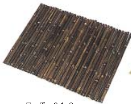
品番：91-2 品名：黒竹すのこ