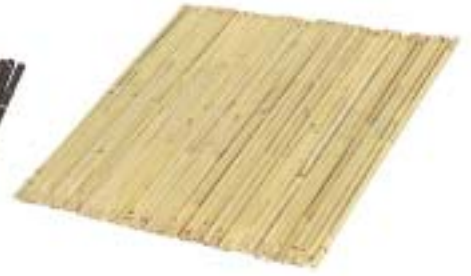
品番：91-3 品名：女竹すのこ