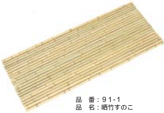
品番：91-1 品名：晒竹すのこ

ご注文の際は、竹の長さ× 巾（網み下がり） 竹の太さをご指示願います。 3平方尺以下及び竹の太さが標準以外のものは割高になります。